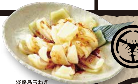
淡路島玉ねぎ オーブン焼き