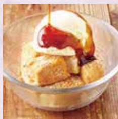
もっちりわらび豆腐アイスのせ