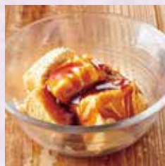
もっちりわらび豆腐