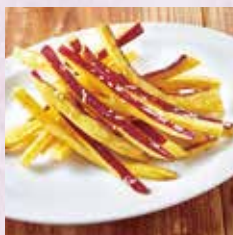
スティック大学芋